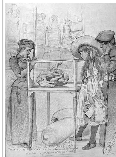
Agli scavi di Pompei. La bella Napoli, di Christian Wilhelm Allers. Napoli 1893.